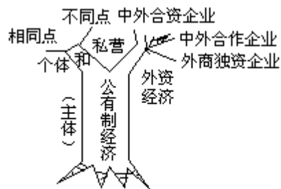
生产力的状况[发展水平不高而又不平衡(决定因素)]

接着给了学生一个启示：同学们只要回忆一下树的根、茎、叶各自的功能和彼此之间的内在联系，就能联想到这里的根、主干、枝各指这里的什么。